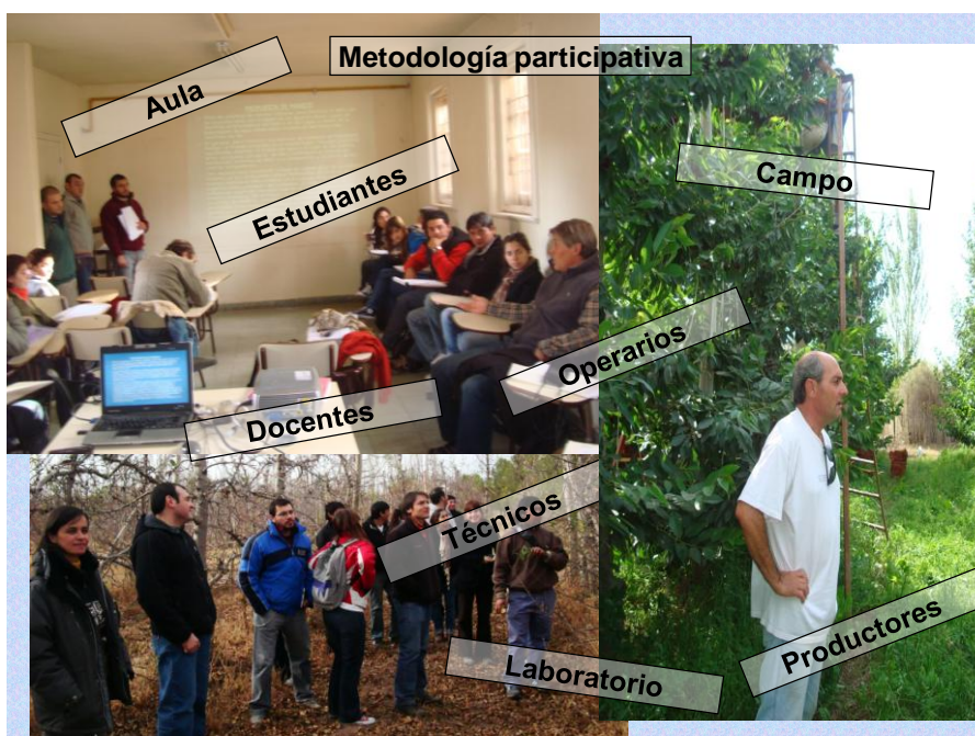
FIGURA 1. Metodología participativa. Presentaciones orales grupales con el conjunto de estudiantes cursantes, docentes de la cátedra y docentes invitados, productores, operarios y técnicos de cada Unidad Productiva. Visitas a las distintas UP's ubicadas en la Región del Alto Valle, Patagonia, Argentina.

De la encuesta final individual y escrita completada por todos los estudiantes al finalizar el cursado, durante los tres años de trabajo se pudo observar que el 87% de los estudiantes encuestados en los años 2010, 2011 y 2012 opinaron que los objetivos enunciados en los trabajos prácticos se cumplieron y el 88% consideró interesante la metodología utilizada (figura 2). Un 95% piensa que esta metodología participativa le generó nuevos interrogantes y el 89% cree que los trabajos prácticos le aportaron herramientas para comprender los conceptos de la materia. Finalmente el 67% de los estudiantes encuestados en el espacio temporal planteado, opina que la Agroecología como disciplina, le permitió visualizar la solución de problemas en el sistema productivo desde la multidimensión del pensamiento y el análisis holístico del agroecosistema aunque el 29% pudo llegar a esta conclusión sólo parcialmente.