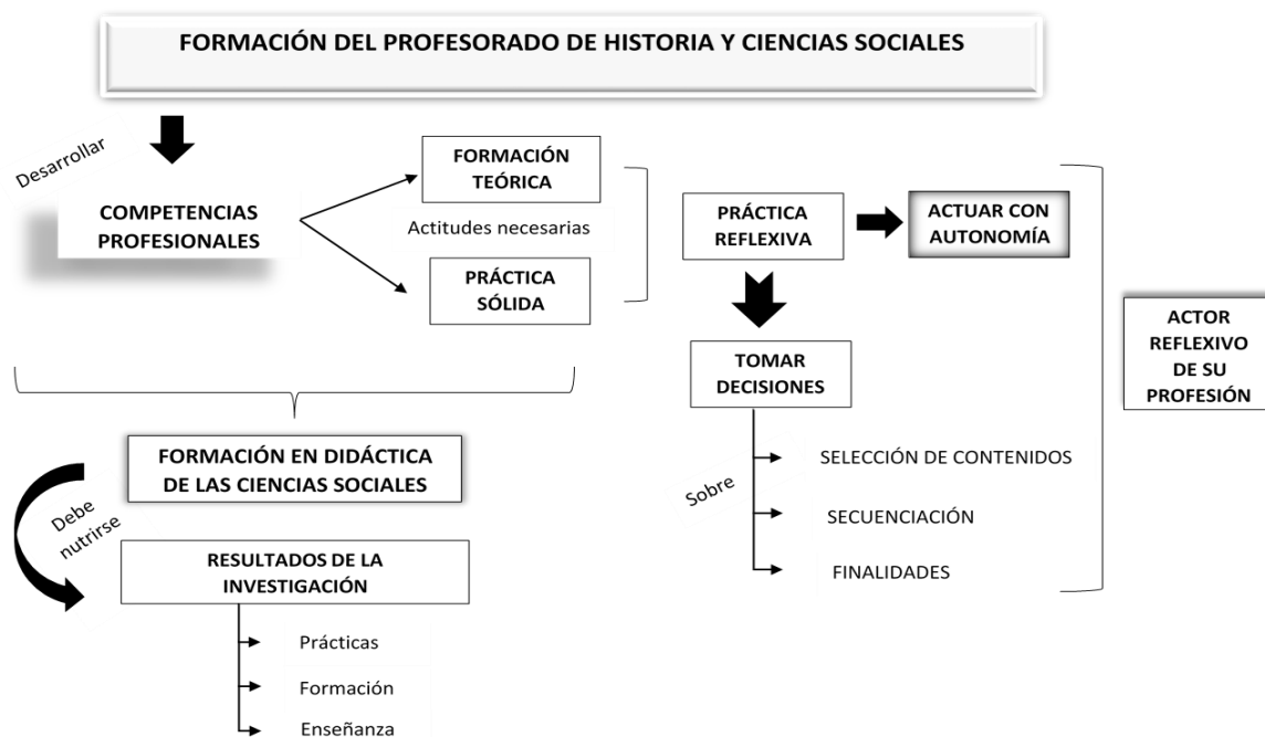
ESQUEMA N ° 1. La formación del profesorado en Historia y Didáctica de las Ciencias Sociales la Historia. Elaboración propia.