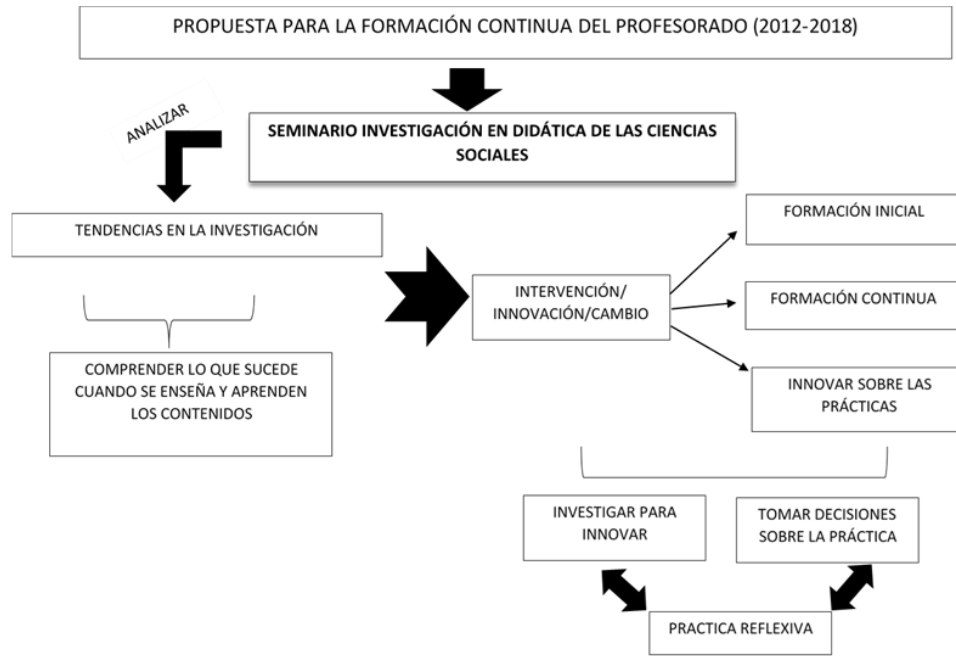
ESQUEMA N ° 2: PROPUESTA SITUADA PARA LA FORMACIÓN CONTINUA DEL PROFESORADO (2012-2018). Elaboración propia

En el segundo esquema ejemplificamos las propuestas formativas que ha impulsado en nuestra universidad.