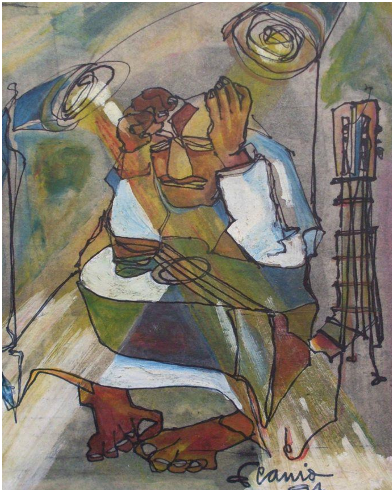
Elsa Scanio. "colapso" anilinas s/papel tratado