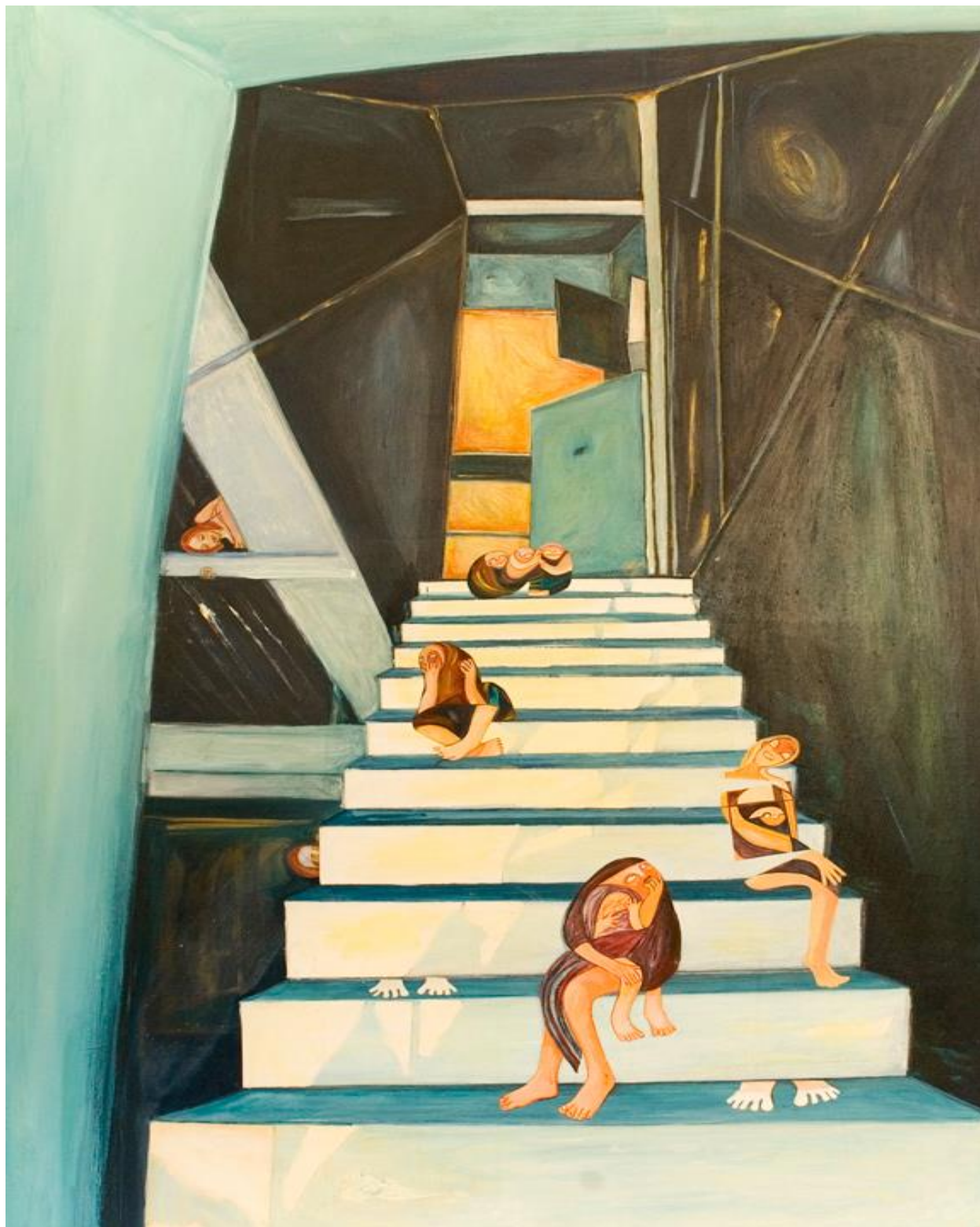
Elsa Scania "Desde el subsuelo"