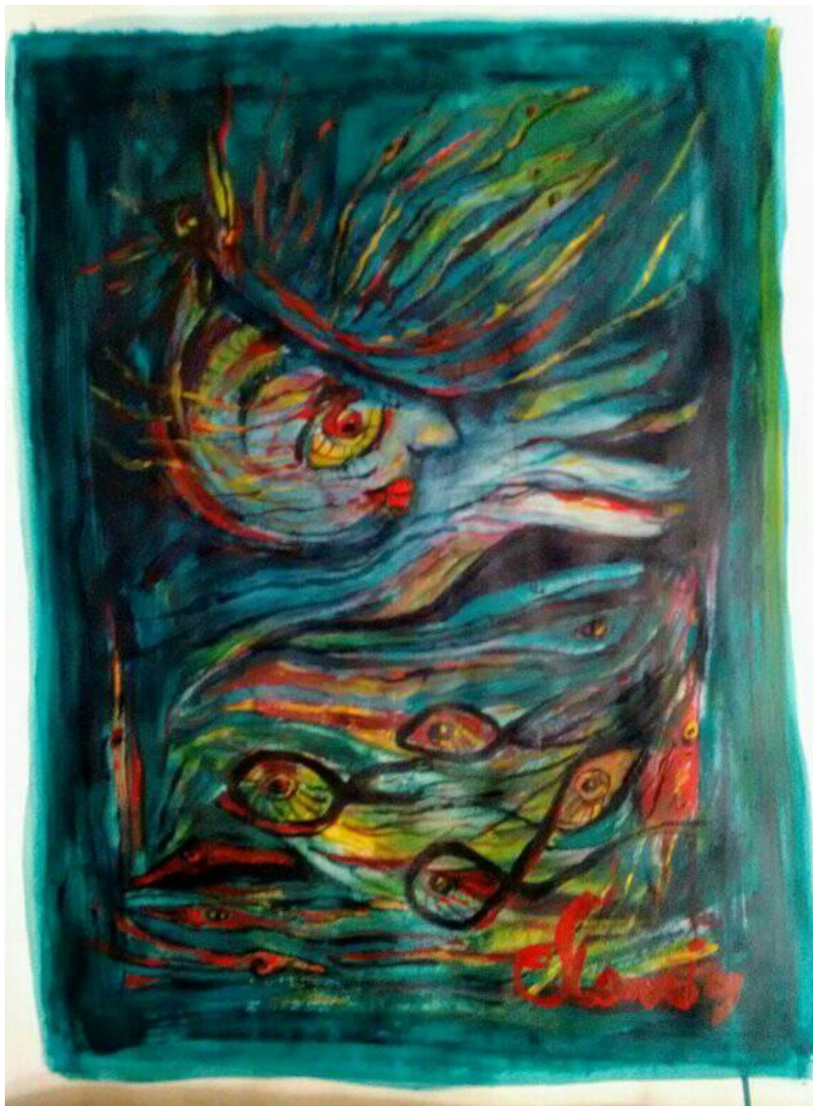
Elsa Scanio. "Maremágnum " uno acrílico s/papel