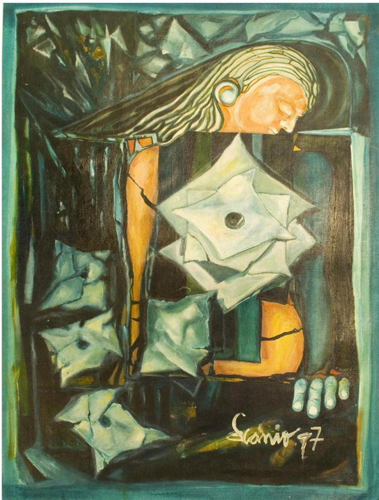
Elsa Scanio. "El hueco " acrílico s/papel