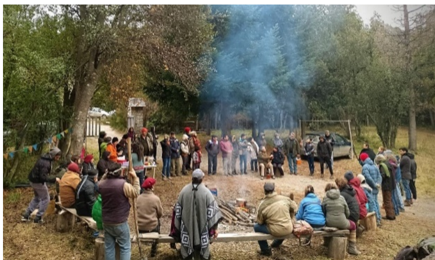
Figura 1.4. Organización mapuce ante desalojo