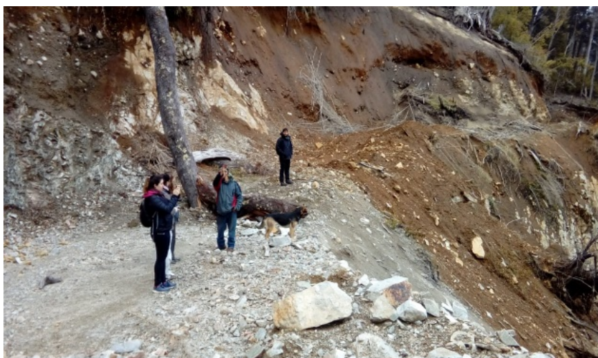
Figura 1.3. Deforestación del bosque

Como ya se mencionó, son cuatro las comunidades mapuce que habitan el territorio y dos de ellas, Lof Quintriqueo y Melo, a 35 kilómetros de la villa; ninguna está exenta de disputas, tensiones y conflictos con