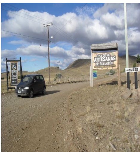
Fuelle: Mariela Manosalva. Año 2011