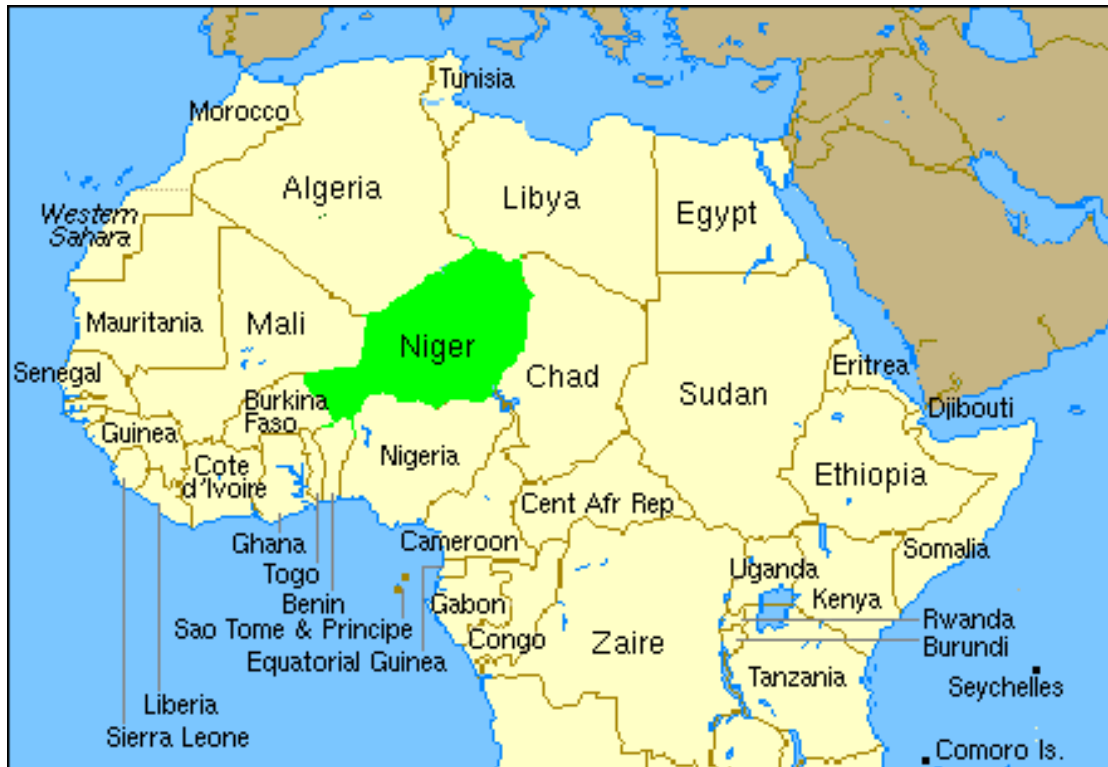
Mapa actual de parte del continente africano, en el que se destaca al país Níger.