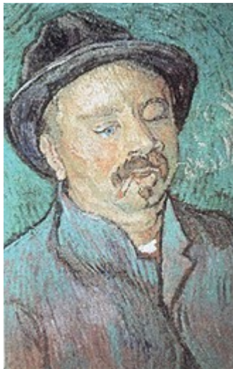
VINCENT VAN GOGH Compañero de manicomio, 1888.

Alfred Kubin fue un artista austríaco que se dio a conocer a principios de siglo por sus dibujos grotescos, macabros y hasta terroríficos. Escribió e ilustró una novela kafkiana. La otra parte, sobre una utopía de artistas que acaba convertida en una hecatombe. El dibujo se titula "El demente Van Gogh", y nos muestra al artista sometido a la angustia del cuadro en blanco, incapaz de separarse de él y mirando de reojo al exterior, como si no fuera capaz de componer solo su trabajo, algo que Kubin hacía con facilidad, demostrando que "el sueño de la razón produce monstruos", como decía Goya, la ausencia más llamativa de la muestra.