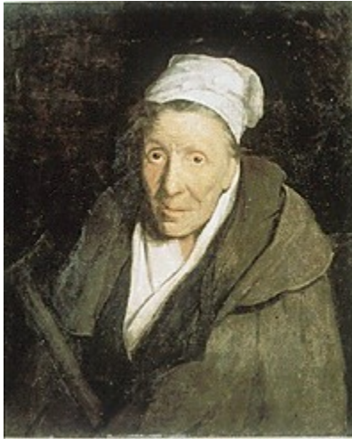
THEODORE GERICAULT Maníaca ludópata, 1822.

Además de actor, poeta, creador del teatro de la crueldad y artista, Antonin Artaud fue un enfermo crónico que conoció su primer manicomio a los 19 años. Entre medias formó parte de los surrealistas y dedicó un año a los alucinógenos en México. Al igual que en sus escritos, Artaud intentaba en sus dibujos acceder a mundos que el lenguaje no pudiera interpretar y conseguir estados semejantes a los que se procuraba con la droga. Creía en el poder mágico de sus dibujos, como esta contorsionada Cabeza azul, realizada en 1946 en el manicomio en el que moriría dos años más tarde.