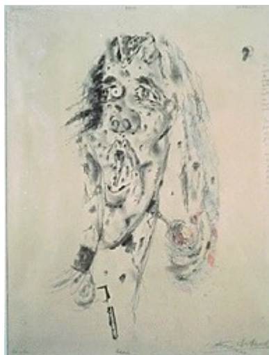
ANTONIN ARTAUD La cabeza azul, 1946